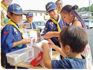
令和5年度街頭募金の様子

赤い羽根共同募金 10月1日～ 3月31日 歳末たすけあい募金 12月1日～12月31日