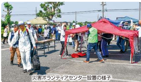
災害ボランティアセンター設置の様子

（注1）千葉県災害対策コーディネーター茂原 （注2）日本赤十字防災ボランティア茂原市地区協議会 （注3）地区社会福祉協議会