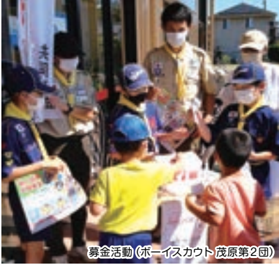
募金活動(ボイスカウト茂原第2団)

■歳末たすけあい募金は、昨年末から年始にかけて、市内の生活が困窮している世帯、児童養護施設の児童、ねたきりの高齢者や障がいのある方に、年末年始を穏やかに過ごせるようお見舞金をお届けしました。また、民間福祉団体の活動支援、ひとり暮らしの高齢者の見守りをかねて、カレンダーとマスクをお届けしました。