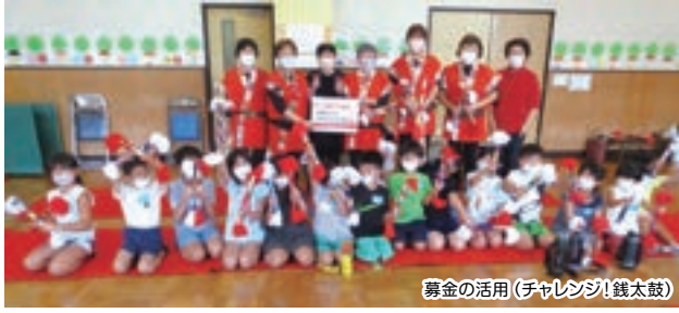
募金の活用(チャレンジ!銭太鼓)

■赤い羽根共同募金は、茂原市で集まった募金の7割が茂原市、3割が千葉県内の生活困窮者や支援の必要な子どもたち、高齢者や障がいのある方々に向けた支援をはじめ、様々な地域福祉活動、火災・災害に対する支援に役立てられます。昨年度の活動の一部ですが、写真のような地域福祉活動に活用させていただきました。