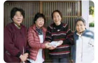
出来たてのお弁当をお届けしています

地区ボランティア会では、料理好きな方、ボランティア未経験の方など、お弁当作りを一緒に行うボランティアを募集しています。活動の様子も見学できますので、まずはお気軽に当協議会までお問い合わせください。