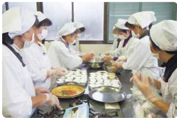
ボランティア活動の様子

市内13地区にある地区ボランティア会では、見守りが必要とされているひとり暮らし高齢者などのお宅へ、手作りのお弁当を持って訪問し、安否や健康状態の確認を行っています。