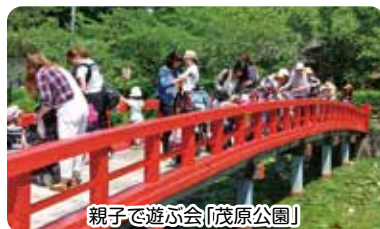
親子で遊ぶ会「茂原公園」