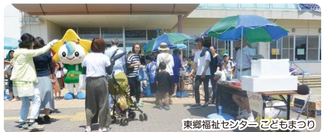
東郷福祉センター こどもまつり