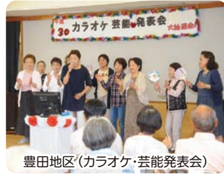
豊田地区(カラオケ・芸能発表会)