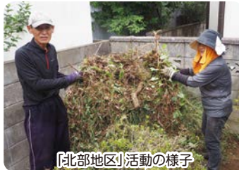
【北部地区】活動の様子

※会員制…手助けを必要としている方(利用会員)を、自分のできることで何か役に立ちたいと思っっている方(協力会員)が有料でお手伝いをするサービスです。