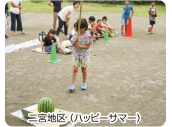
三宮地区(ハッピーサマー)