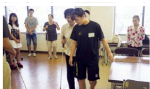
夏の体験ボランティア

ボランティアの登録・斡旋、ボランティア保険の加入、災害ボランティアの活動支援など、ボランティア活動を支援しています。また、市内小中学校などへ講師を派遣し、福祉教育を行っています。