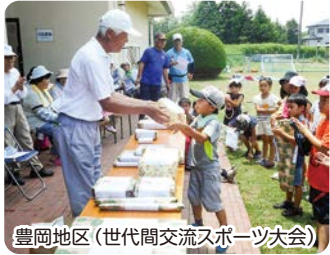
豊岡地区(世代間交流スポーツ大会)