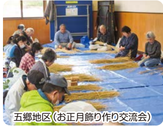
五郷地区(お正月飾り作り交流会)

地区社協では一緒に活動してくれる方を募集しています。地区社協活動に興味のある方は本会までご連絡ください。