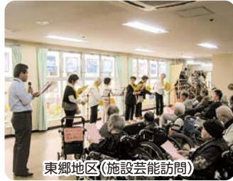
東郷地区(施設芸能訪問)