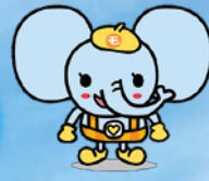
茂原市社協 マスコット「ふくぞう」