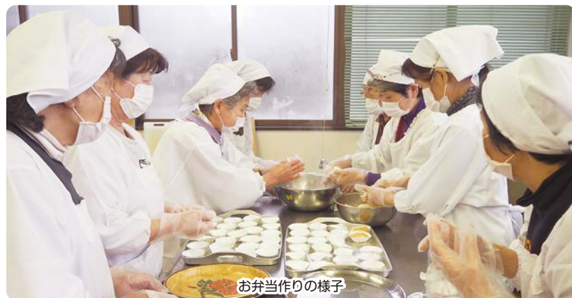
お弁当作りの様子

見守り型食事サービスは、ひとり暮らし高齢者などのお宅へ、手作りのお弁当を持って訪問し、安否や健康状態の確認を行っています。