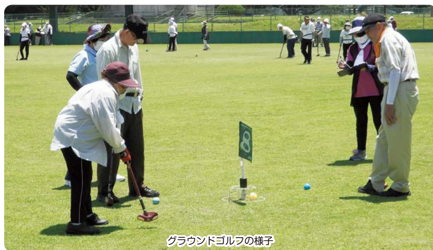
グラウンドゴルフの様子