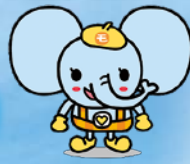
茂原市協 マスコット「ふくぞう」