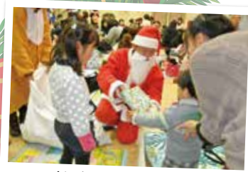
サンタさんありがとう♪