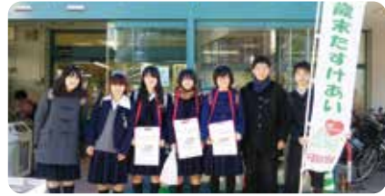
長生高校JRC委員会のみなさん

市内の店舗やJR茂原駅前にて実施した街頭募金には、茂原市ボランティア連絡協議会をはじめ、茂原聖マリア幼稚園児、高校生、福祉関係団体などの方々にご協力頂き、赤い羽根（10月実施）264,738円、歳末たすけあい募金（12月実施）575,680円の募金がよせられました。また、活動場所を提供していただきました店舗・施設のみなさまありがとうございました。