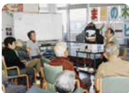
まきの木苑で紙芝居