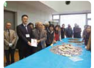
茂原市長寿クラブ連合会のみなさん

12月10日、茂原市長寿クラブ連合会より、まごころ募金が寄贈されました。この募金は、会員の方が1年間貯めた1円玉などを歳末たすけあい募金に寄附していただく活動です。