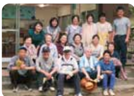
活動先である獅子吼園にて

※国際協力NGOジョイセフ 途上国の妊産婦と女性を守る活動を行う民間団体。 古切手などを支援金に返還し、ワクチンなどの助成を行う。