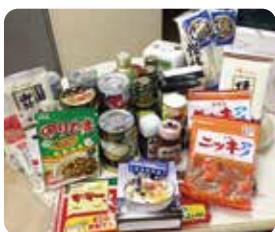
前回よせられた食品の一部

「フードバンクちば」では、品質に問題がないにも関わらず廃棄されてしまう食品を企業や家庭から寄附していただき、福祉施設や生活に困窮している方へ、無償で提供する活動を行っています。前回は、5.45トン(うち当協議会受付分14.8kg)の食品が集まりました。ご家庭に眠っている食品がありましたらご協力をお願いします。