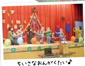
ちいさなおんがくたい♪