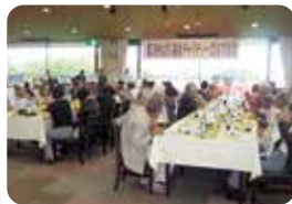
大会終了後のセレモニー

10月2日(土)房総カントリークラブにて、第7回もばら福祉チャリティーゴルフ大会が開催され、124名が参加し、仲間とのプレーを楽しみました。ワンオンチャレンジなどで集まったチャリティー募金26万円が、大会終了後に実行委員会より、当協議会に寄附されました。この寄附金は、ひとり暮らし高齢者などの見守り活動や、サロン活動などの地域福祉活動に活用させていただきます。参加していただいたみなさまありがとうございました。