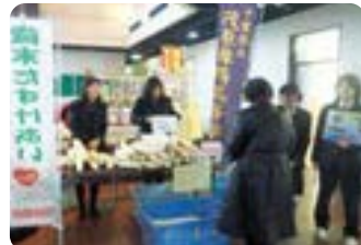
茂原樟陽高等学校のみなさん

12月11日、茂原樟陽高等学校の生徒のみなさんが、規格外野菜の無料配布を行いました。同時に募金箱も設置し、歳末たすけあい募金への協力を呼びかけました。